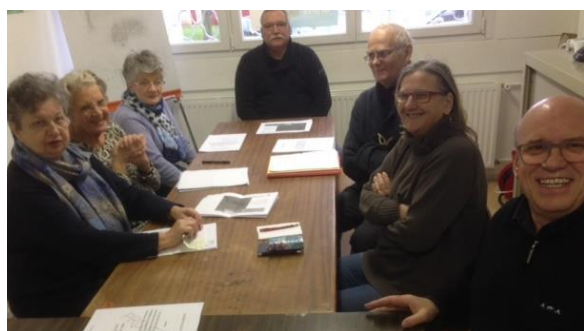
La délégation qui a rencontré le bailleur.